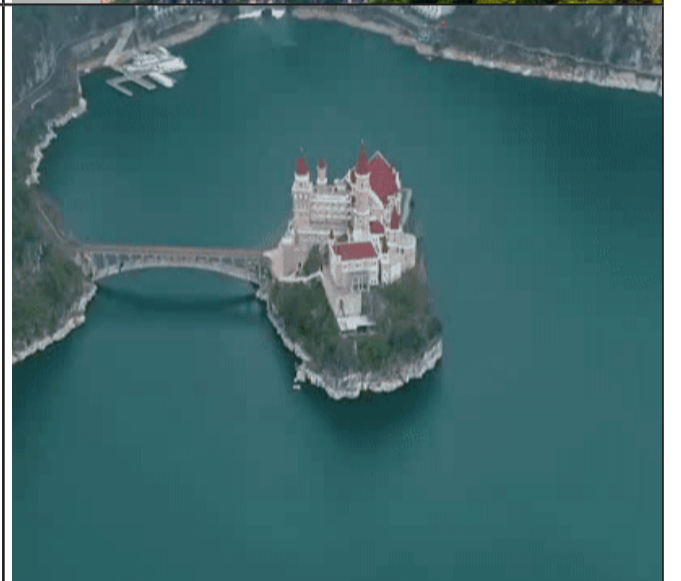
坐落于万峰湖的吉隆堡，靠一座桥与外界连接，被称为中国版的天鹅堡。单看这张图，是不是觉得像到了欧洲。