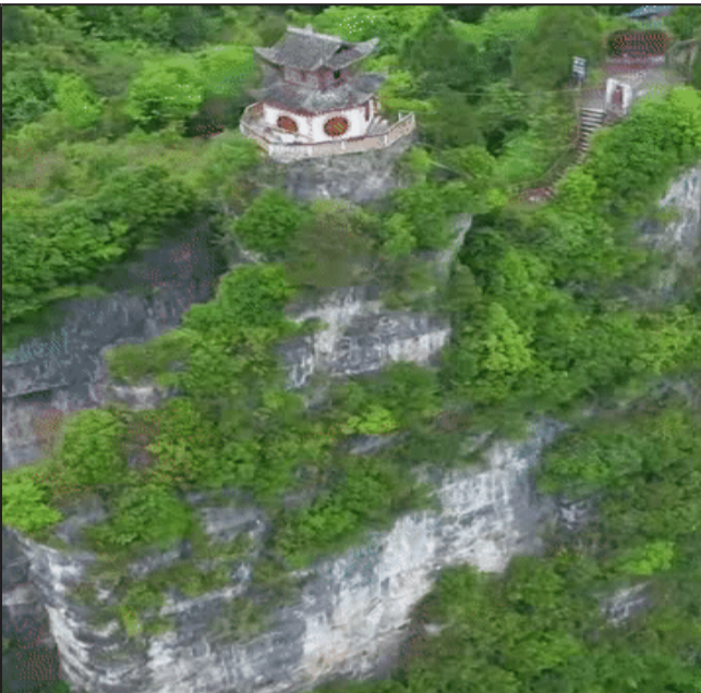
看这个立于悬崖绝顶上的寺庙，山庙一体，风光绝景，哪个仙人在这里偷偷修炼？