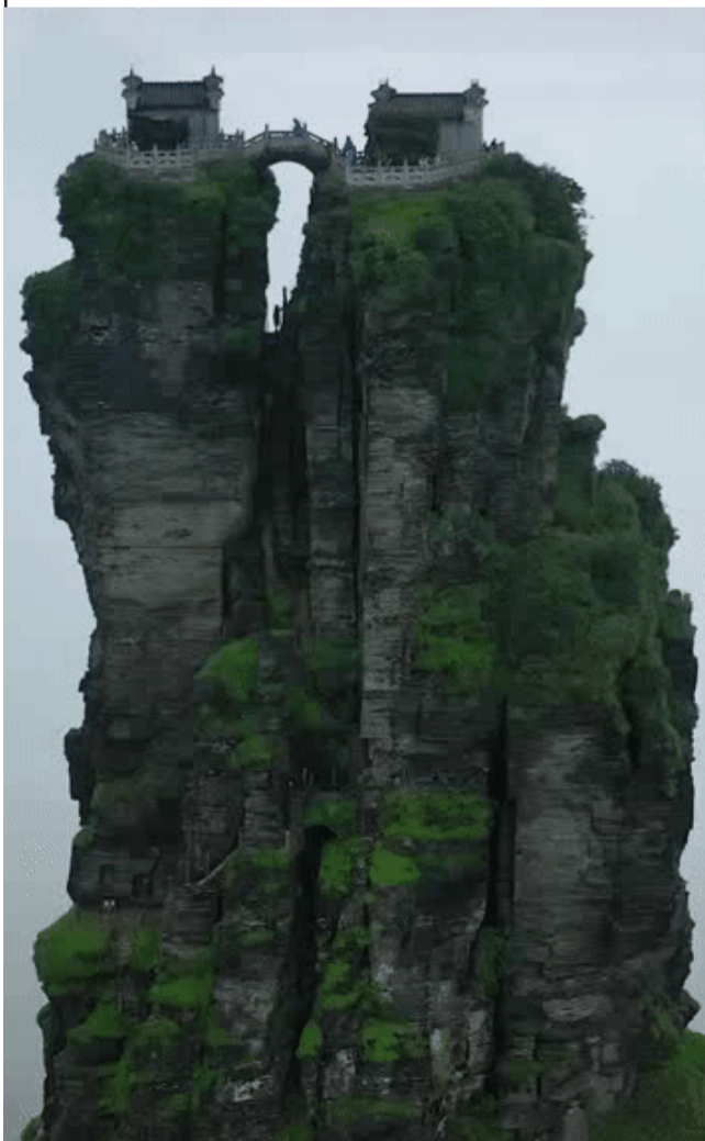
05逆天的贵州大山里，一座座建筑屹立不倒，如至仙境！它们离尘世最远，离天堂最近，也许这是仙人们在世间的最后一块净土。