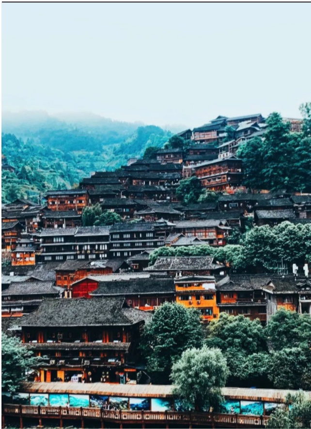
西江千户苗寨，比重庆洪崖洞更具风情，木质的魔幻建筑，让人如入异世界。