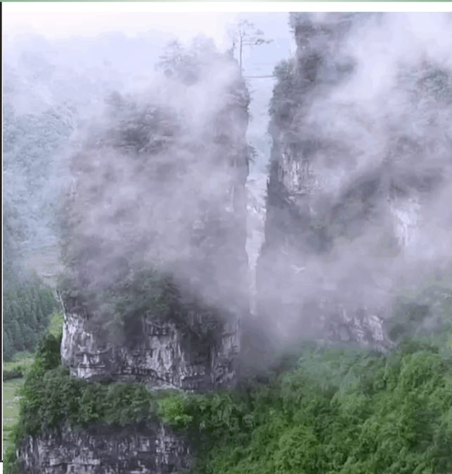
你看这座悬空的小木桥，简直神了！请问谁敢走上去？