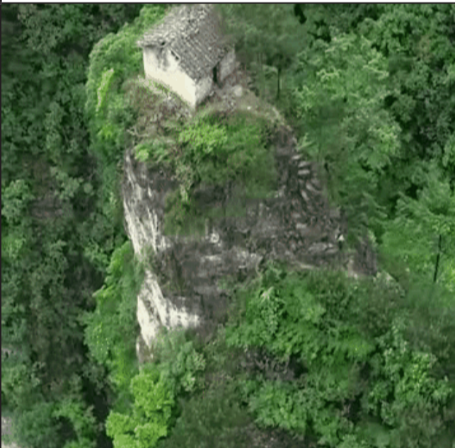
再看看这座悬崖，看上去没有一根阶梯，竟坐落一座房子，很好奇是怎么建成的？