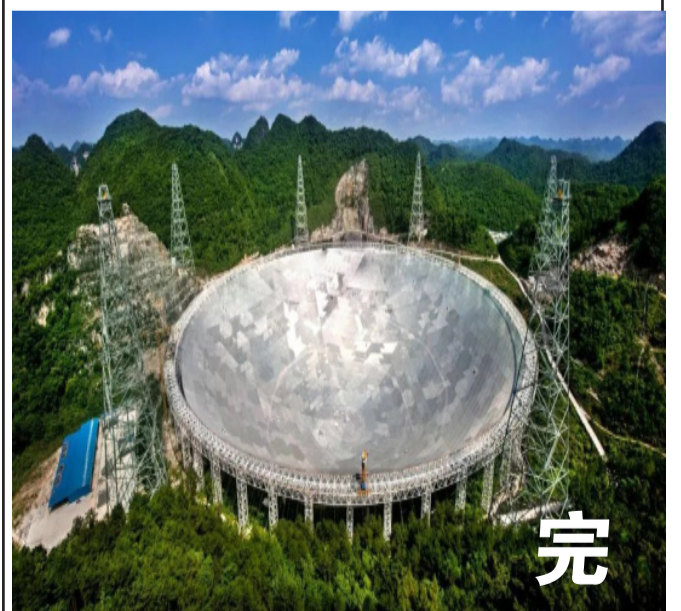
在喀斯特洼坑中，还藏着一个不能做饭的大锅，——中国天眼。