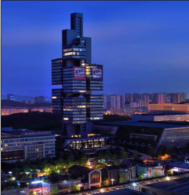
贵阳生态会展中心201大厦，又称不规则大厦。十个办公单元悬挂在离地面36米的空中，让人不得不佩服设计师的脑洞，又一个“疯了”的建筑！