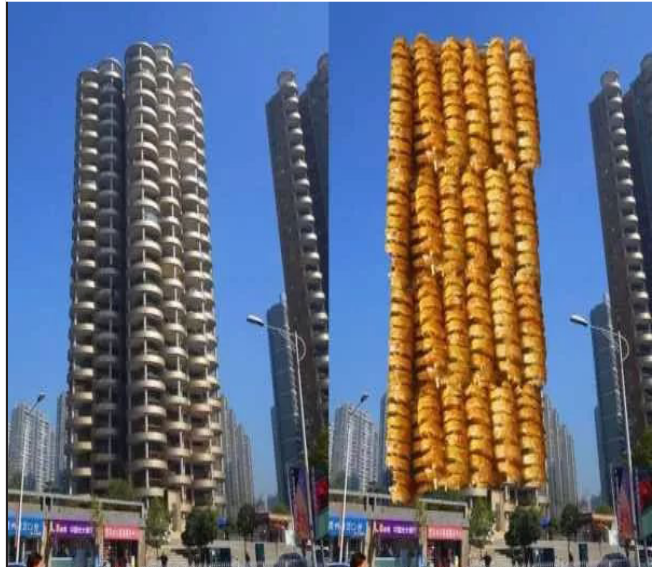
04逆天的贵州建筑，不按理出牌，惊艳奇绝！贵州建筑的奇绝，不像重庆那样在把路修到楼里，而是把建筑逆天而建。