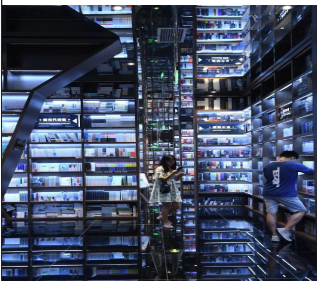
贵阳的钟书阁书店，这样的镜像书店，科技感满满，整个人像置身在时空隧道中。