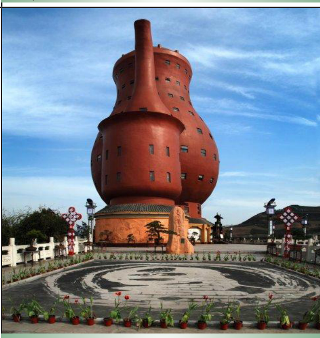
湄潭县的“天下第一壶”，打破了最大茶壶纪念碑的吉尼斯世界纪录。