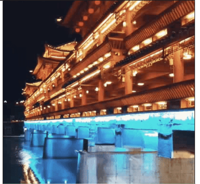
谁说只有重庆的洪崖洞魔幻的，都匀西山大桥也不差，每逢夜晚，木雕精致，流光溢彩，美不胜收。