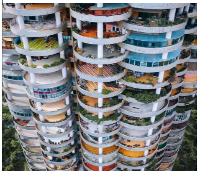
贵阳的龙禧苑，每一层都是180°无死角的半圆形阳台。层层叠叠上来，筑成烤面筋大楼，看过去满满的赛博朋克风，真想撒点孜然辣椒，来上几串烤面筋。