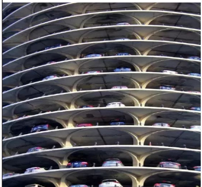
逆天二连，你敢相信这居然是车库？真是让人好奇这个车怎么开上去的