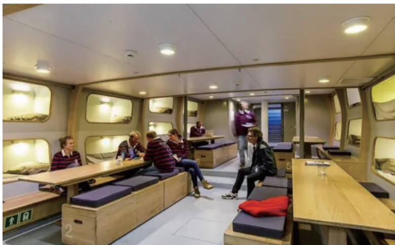
图是“威尔德天鹅号”的内部空间。看起来似乎还不错，但要在这样的地方生活几十天，每个人都无法真正放松。个中滋味，不亲历，体会不到。