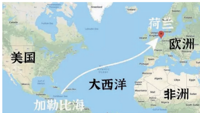
他们的航线图： 从加勒比海，横跨大西洋，回到荷兰

两百多年来，大西洋上一直有个传说，一艘永远无法返乡的幽灵船，只能在大西洋上漂泊，永远无法靠岸。人们称这艘船为，“飞翔的荷兰人”。