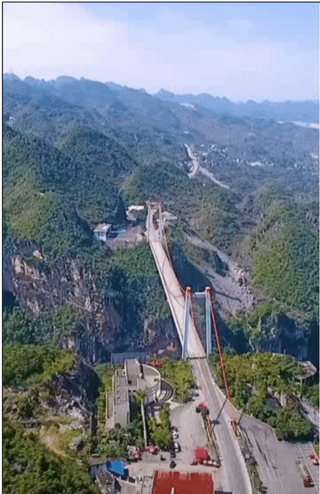
世界排名No.10大桥： 关兴公路北盘江大桥，宛若飞跃天堑。