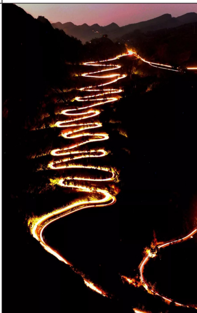
晴隆二十四道拐，中国抗战的生命线，全程直飙冷汗，刚转过一个弯，又忙着转下一个弯。

贵州多山，这是我们都知的事，因此，在贵州诞生了许多条让你荡气回肠的盘山公路，每一条都是美到你想哭，开到你想吐。