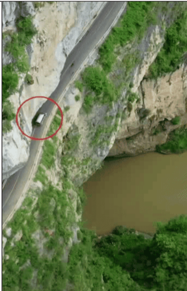
左手峭壁，右手悬崖，眼睛在天堂，身体下地狱，就问你慌不慌！