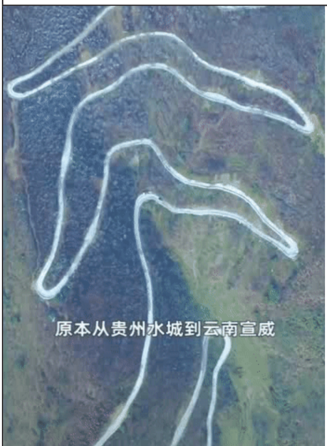
原本从贵州水城到云南宣威