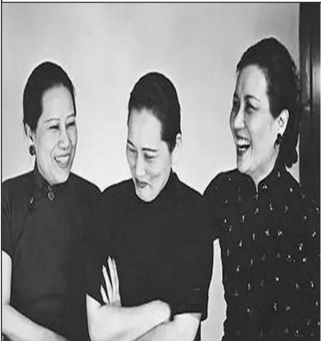
12最有权势的姐妹照 1940年，宋氏三姐妹在抗战期间的合影照。