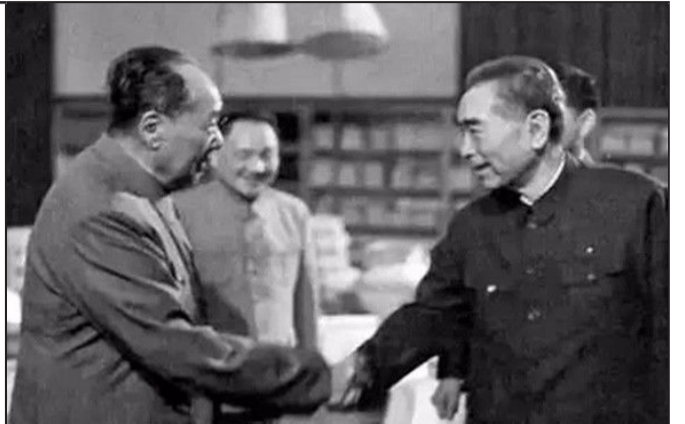
16最后一次握手 1974年5月29日当晚，周总理住进了305医院，这是当天两位伟人的握手告别，没想到成为最后的握手。