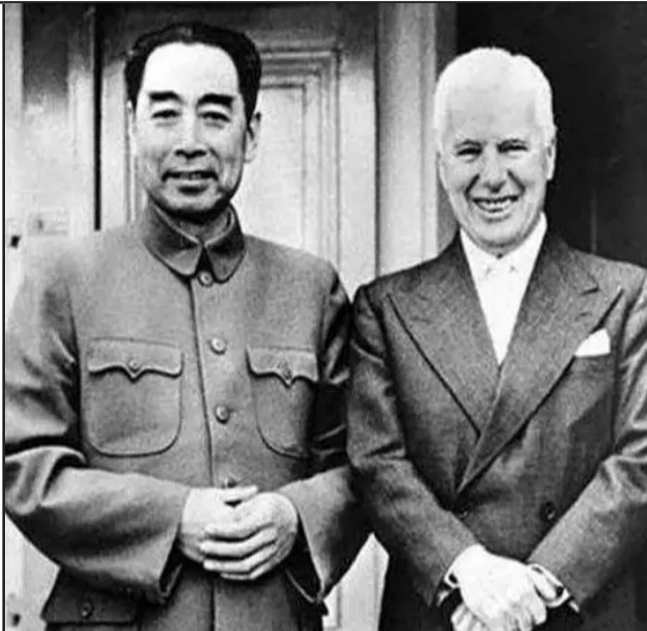
13气场十足的合照 1954年夏，周恩来总理率领中国代表团出席日内瓦会议期间，在日内瓦莱蒙湖畔与卓别林合影。周总理和卓别林，这是政界和喜剧的穿越。