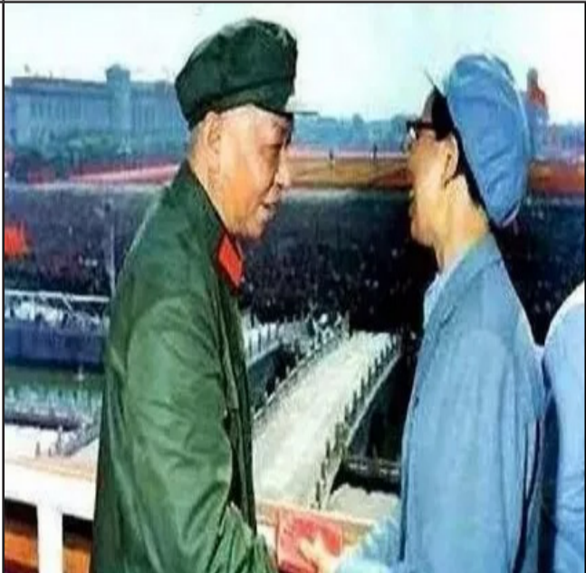
14最让人五味杂陈的合影 1966年文革初期，刘少奇和江青在天安门城楼上交谈。随后她对他做了什么？让人感慨万千，一声叹息，五味杂陈。