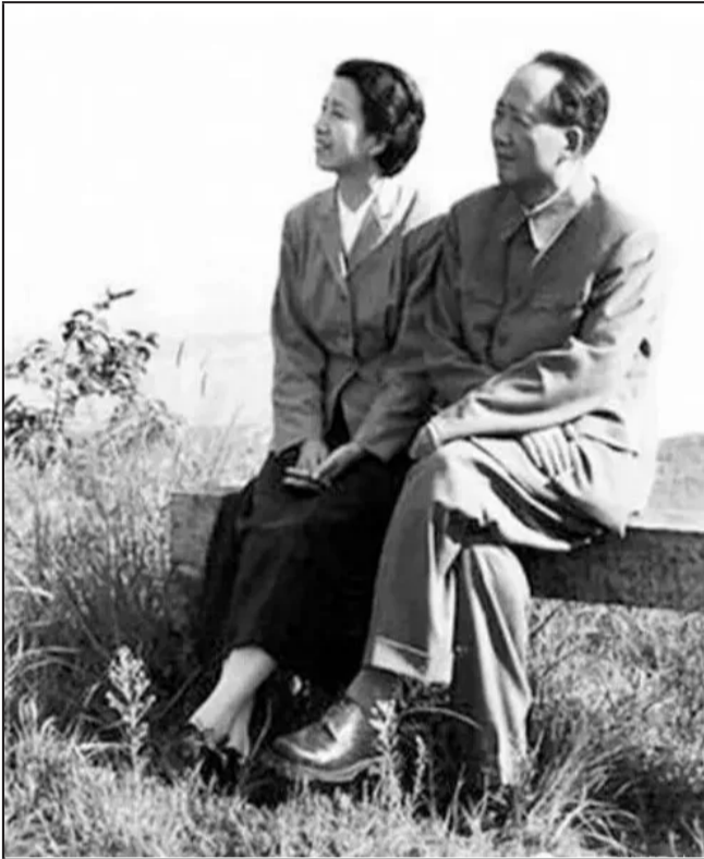
10最有恩爱感觉的合影 毛泽东与江青最有恩爱感觉的一张照片，幸福和谐的伉俪！