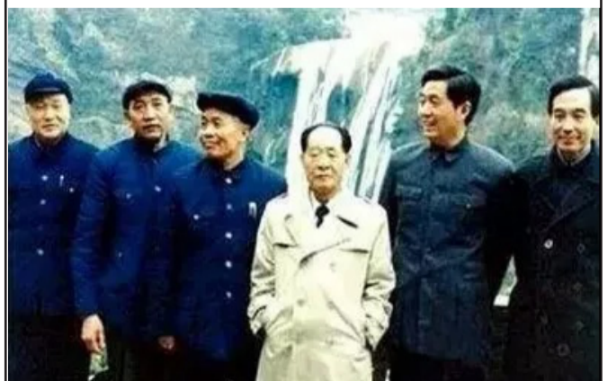
19曾经他们在一起拍过照 1986年2月5日，胡耀邦与时任贵州省委书记胡锦涛（右二）、温家宝（右一）等在黄果树瀑布景区留影。