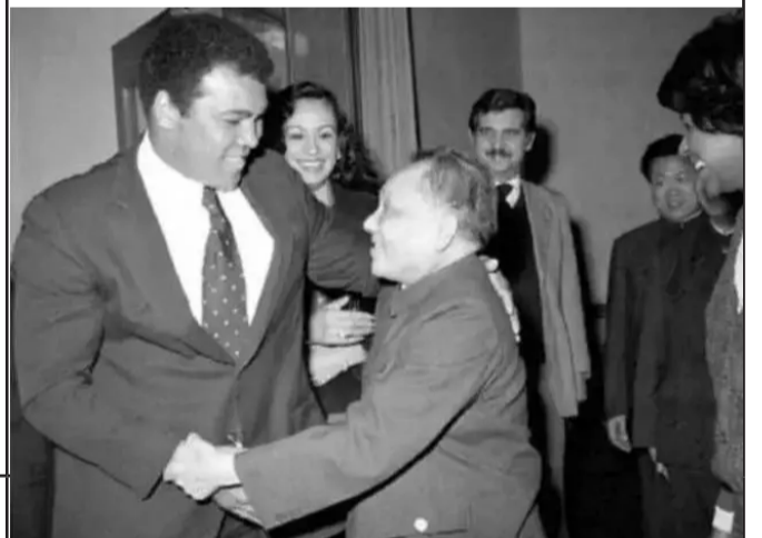
18最萌身高差 1979年，拳王阿里受邀来到北京，邓小平一句让阿里多来中国“带带徒弟”，被禁多年的中国拳击开始“解冻”。