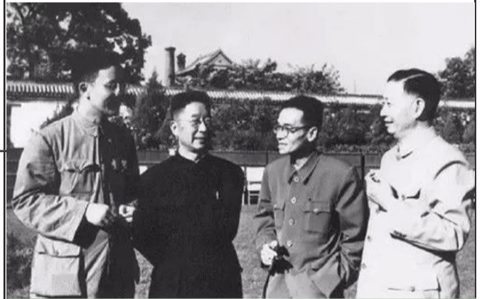
17最跨界的合照 从左至右，华罗庚、老舍、梁思成、梅兰芳，他们分别是数学家，作家，建筑学家和艺术家。四位大师都是各自领域的俊杰。