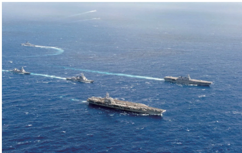
美日海军舰艇在南海海域 举行联合军演

然而，就在中国举国上下同心协力“内防反弹、外防输入”、复工复产、向国际社会伸出援手共度时艰的时候，同样遭受疫情重创的美国，非