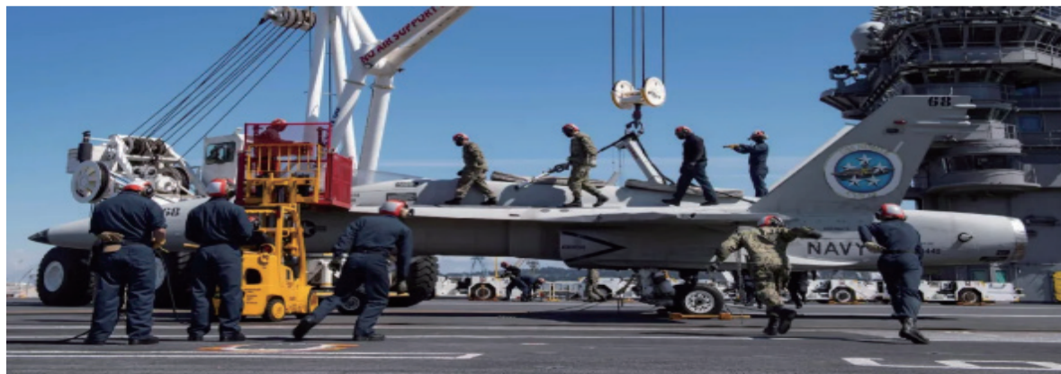
4月15日，正在进行战斗力恢复工作的“尼米兹”号航母。随着疫情蔓延，美国多艘航母“趴窝”，刚刚结束休整的“尼米兹”号不得不开始召回所有舰员重新登舰，并进行出航准备

家安全战略报告将中国定义为“战略竞争对手”，以及随后推出的“印太战略”，南海问题在中美安全博弈领域的重要性进一步凸显。从美国的视角看，南海是维护其在西太平洋海上霸主地位不可或缺的海域和实现美国式海权的重要咽喉水道，也是美国遏制中国崛起和牵制海上力量发展的重要抓手。而在中国看来，南海事关中国的主权、安全和发展利益，是中国国家安全的天然屏障和重要的海上战略通道。因此中美南海博弈是战略性的、结构性的，同时又是不可调和的。我们也不会天真到认为美国可能因为疫情而在南海放我一马，从而可以松口气的地步。这也是为何疫情期