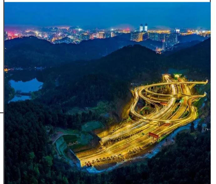
贵阳中环七冲立交桥，最美好的夜景都在这桥上了，行驶之上，足够奇特！