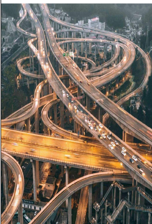
黔春立交，贵州最复杂立交，没有之一。 11条匝道，5层立体交叉设计，走错一条，就是贵阳一日游。更有司机戏言：开上这座立交，我就将自己交给了上帝。