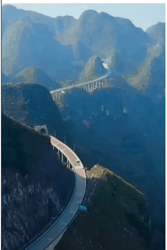
是的，贵州已不是昔日地无三尺平的犄角看见了，现在在你眼前的，是遇沟搭桥的、遇山开山的：逆天改命·钮钴禄·贵州！