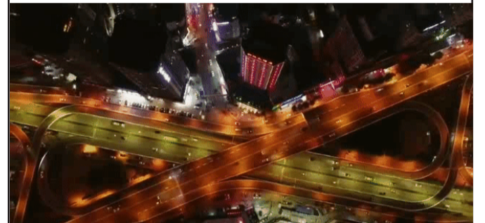
花果园立交，这座三层互通式立交桥，看上去并不复杂，但若走错，也要走到头晕。