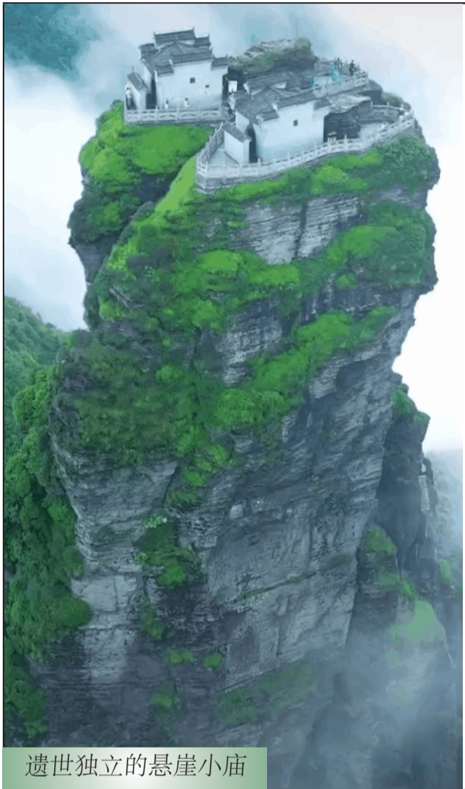
遗世独立的悬崖小庙