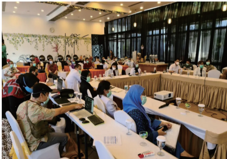
印尼国油医疗集团会场画面