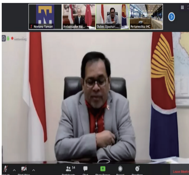
周浩黎大使在开幕式致辞