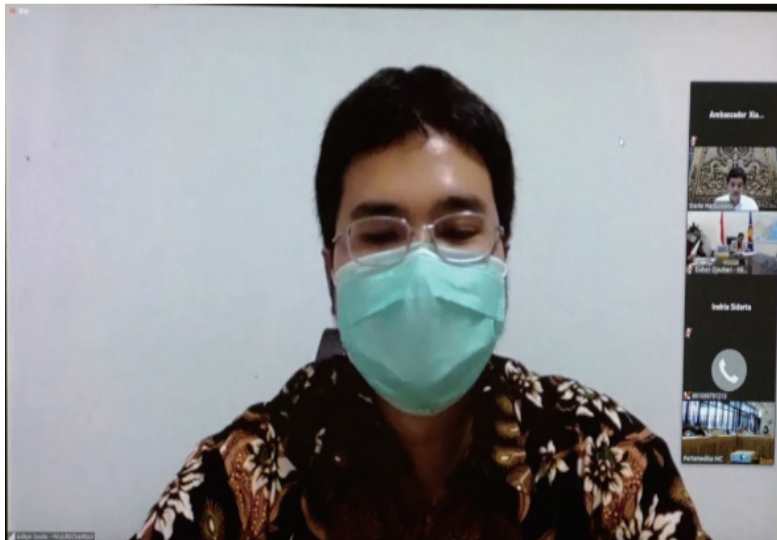
肖千大使在开幕式致辞

印尼与会人员纷纷表示，这是一次及时、务实、专业、成功的专家交流活动，希望双方能够围绕药物攻关、疫苗研发等继续组织开展务实交流，进一步促进中印尼抗疫合作。