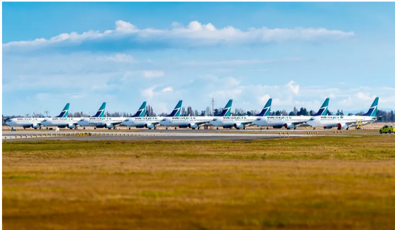
加拿大温哥华国际机场