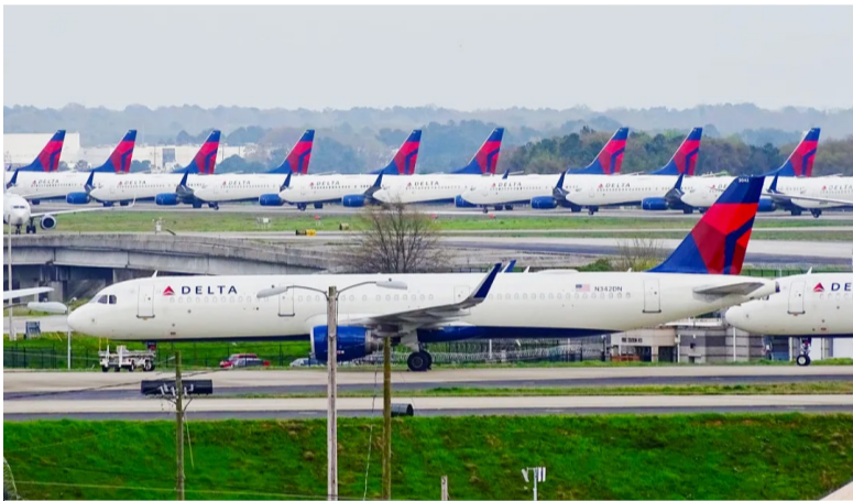
美国亚特兰大国际机场