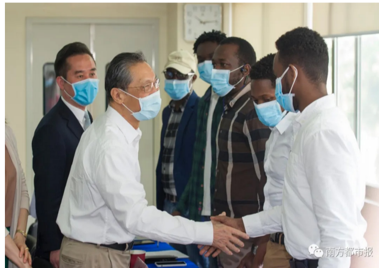
钟南山院士与外籍人士握手问好。