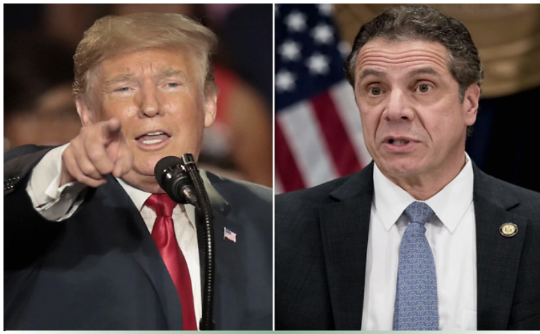
(左) 特朗普和科莫 (右)

人民日报15日晚间消息，据美国约翰斯·霍普金斯大学发布的统计系统显示，截至美国东部时间15日上午9点44分，全球新冠肺炎确诊已超过200万人，达到2000984人，死亡128011人。确诊人数居前五位国家是美国、西班牙、意大利、德国和法国。