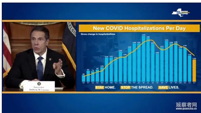
记者会现场视频截图 记者会现场视频截图