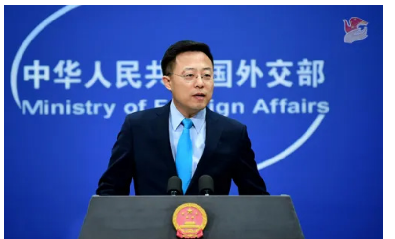
外交部发言人赵立坚