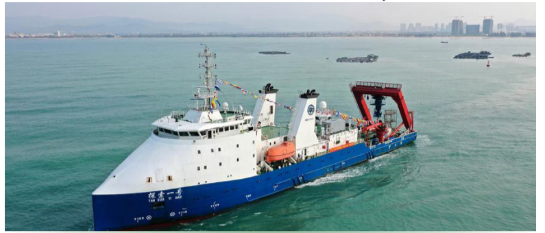
中科院“探索一号”船搭载“深海勇士”号载人潜水器从崖州湾科技城南山港码头启航，开始科考任务（3月10日摄，无人机照片）。

界自由港通行做法和先进经验，对接国际经贸新规则，完善国际贸易“单一窗口”，建立国际投资“单一窗口”，努力在内外贸、投融资、财政税务、金融创新、出入境等方面探索更加灵活的政策体系、监管模式和管理体制。