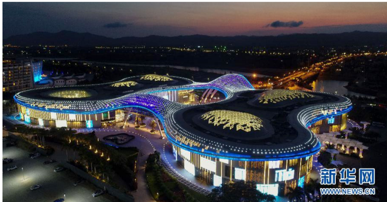
这是位于海南省三亚市海棠湾的三亚国际免税城（2019年4月13日摄，无人机照片）。

2018年5月1日起，公安部授权在海南省实施59国人员入境旅游免签政策，扩大免签国范围，延长免签停留时间，放宽免签人数限制。2019年，共有47.9万人受益于这一政策入境。