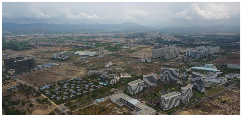
这是正在建设中的崖州湾科技城（4月9日摄，无人机照片）。

探索建设中国特色自由贸易港，海南上下同心、全省动员。自贸港海关监管方案研究、FT账户系统拓展优化、加快博鳌机场作为国际口岸正式开放等工作已全面铺开。