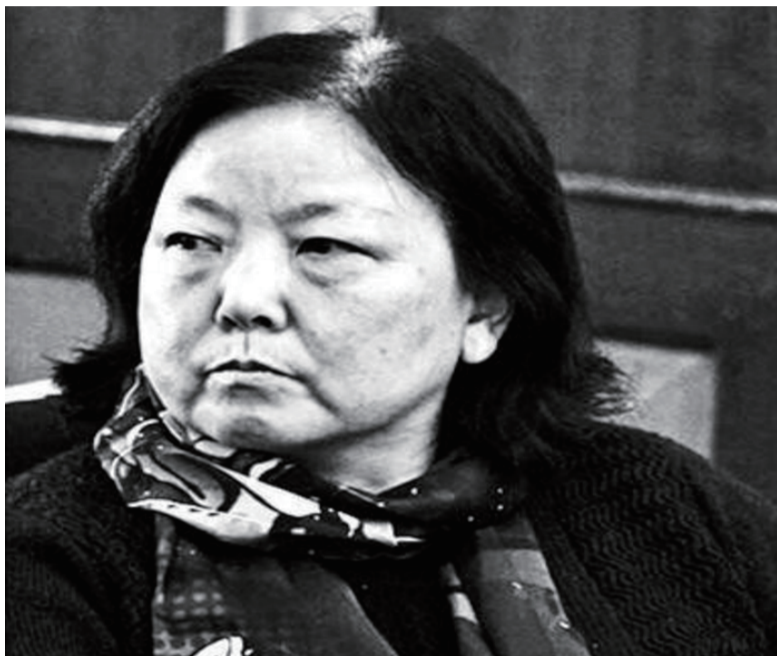
方方日记作者：方方