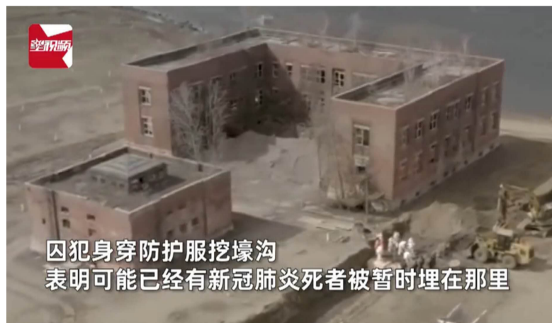
囚犯身穿防护服挖壕沟 表明可能已经有新冠肺炎死者被暂时埋在那里