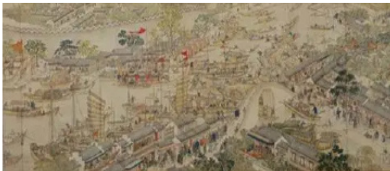
姑苏繁华图 徐扬《姑苏繁华图》，全长1225厘米，画有12千余人，房屋建筑约2140余栋，桥梁50余座，船只4百余，商号招牌2百余块。