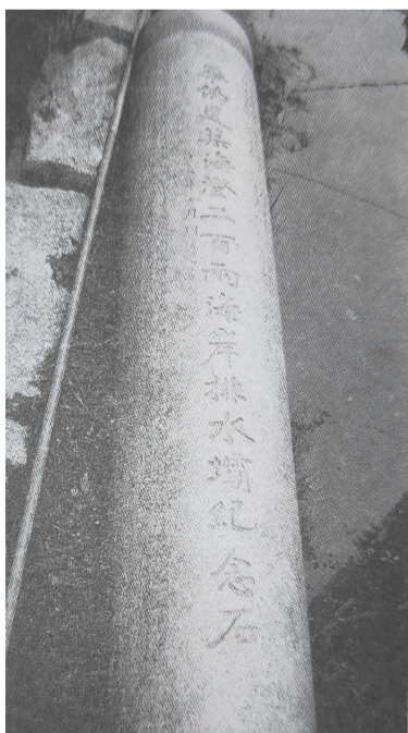
1929年修筑二百两海堤纪念碑

郭美丞逝世后,他的儿子把父亲的遗稿《抗吟残稿》、《呼吁集》、《诗词拾零》、《灵感集》等,辑成《恬庐诗文集》行世。钱穆为其作序:《恬庐诗文集》者,余先受而读之,因以想见美丞先生之为人,其人则诚有志而厚以性情之人也。又能一本其平日之为人而发之于诗,故其诗亦可传也。