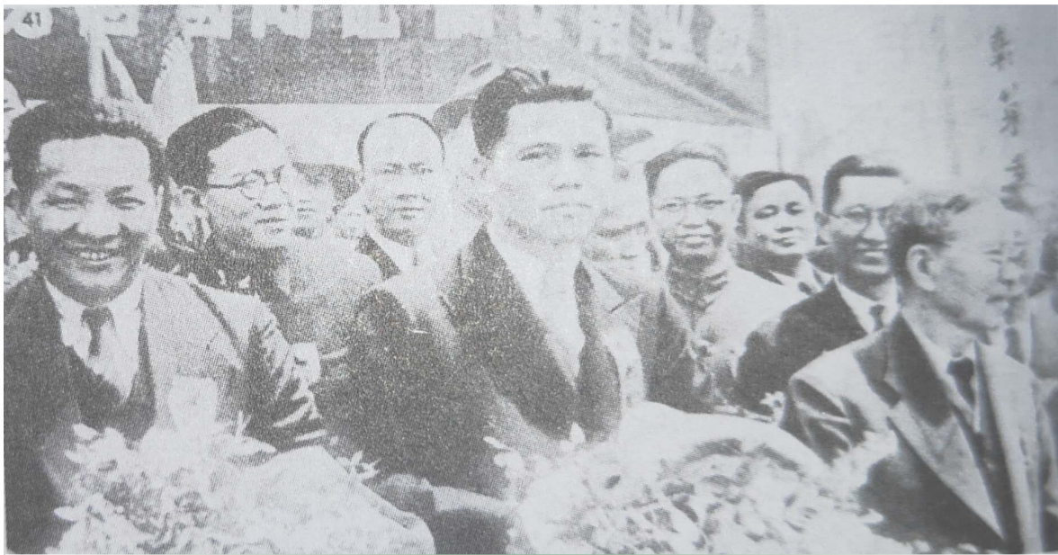
郭美丞(左一)参加南桥回归国慰劳团与陈嘉庚(右一)一起。

资创办浮宫华侨救济所,为贫民免费施医施药。1940年,他捐出海澄南门楼房10间,作海澄县卫生院院舍。1946年福建疟疾猖獗,他购买大量奎宁,托厦门市政府赠送全省各医疗机构。