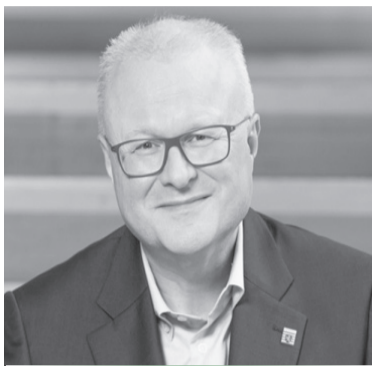
德国黑森州财政部长舍费尔

据美国《旧金山纪事报》报道，当地时间3月30日，美国“罗斯福”号航空母舰上已有超过百人感染新冠肺炎，美国航母舰长紧急写信请求全员下船检测隔离，避免情况恶化。此前，“罗斯福号”在海上传出3人感染之后，确诊人数急剧攀升，资深的军事官员上周表示，舰上4000多位官兵