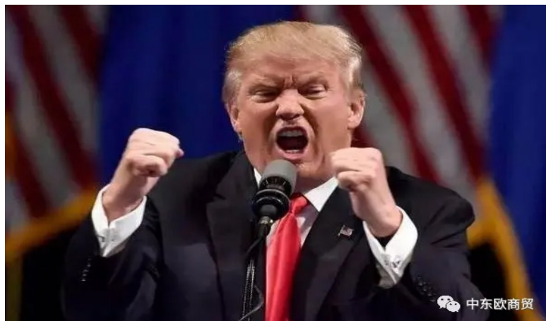
嘶力竭地呼吁全世界的医务工作者支持美国的特朗普