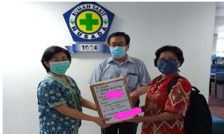
郑医生捐助诊疗所图片