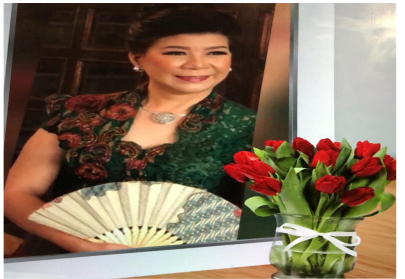
慈善企业家刘惠文女士