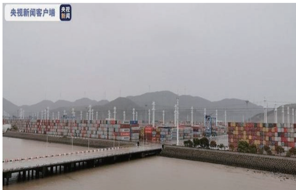
穿山港区集装箱码头