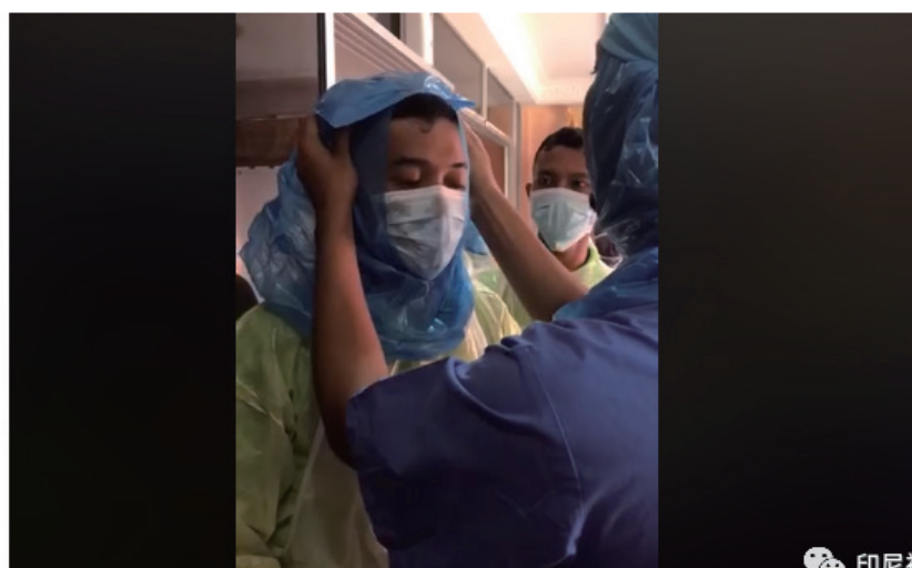
Para Petugas Medis Ini Tutup Kepala Pakai Kantong Plastik Dibolongi Gegara APD Habis

Penulis: Suci Febriastuti - 23 Maret 2020