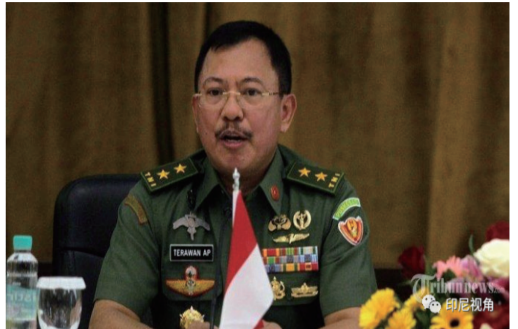
印尼卫生部长德拉万

但这也值得考虑一个庞大的国内市场。拥有大约2亿6千万人口的，国内旅游部门也可以得到刺激。如果政府还通过各种折扣和各种激励的活动向他们提供激励，国内游客也将很高兴。折扣不仅适用于航班，而且还适用于其他各种运输方式，例如轮船。公众正在等待政府行动。