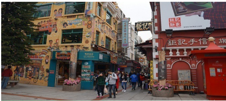
澳门官也街买鸡仔饼手信街

能到孙中山的功业上为起到的作用呢？因为殖地，在政治上较自由，这便於宣传革命。孙中山选择了澳门，进行革命的工及余卒业之问世，开始也。在纪念孙中山先生地，光是有两条路，一条是孙逸仙大仔的“孙逸仙博士路”。另外还出邮票、竖铜像、兴建纪念山先生，处处都可以到与怀念。