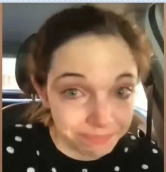
501万次播放 所以我在这里 求求你们！就老老实实待在家 0:08