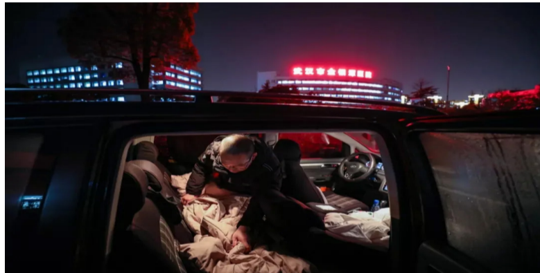
武汉医生宁愿在车上过夜，也不愿增加传染风险